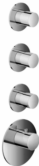
MONTAGE HORIZONTAL ET VERTICAL HORIZONTAL OR VERTICAL ASSEMBLY