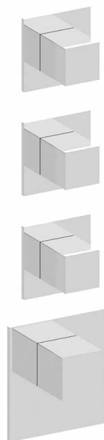
MONTAGE HORIZONTAL ET VERTICAL HORIZONTAL OR VERTICAL ASSEMBLY